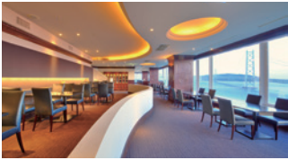
ダイニング&バー キーウエスト Dining & Bar KEY WEST