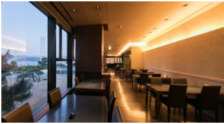
日本料理・寿司 有栖川 Japanese Restaurant ARISUGAWA