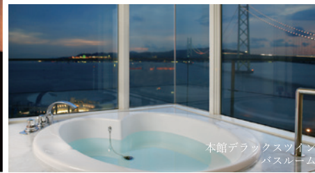
本館デラックスツイン バスルーム