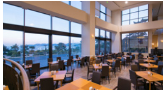
テラスレストラン サントロペ Terrace Restaurant ST.TROPEZ