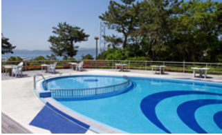
屋外プール Outdoor swimming pool