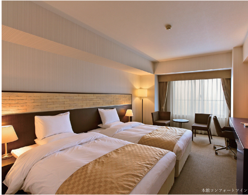
本館コンフォートツイン

ほぼすべての客室がオーシャンビュー。 デイタイムのほか、夕日、夜景など、表情豊かに変化する素晴らしい眺望をお部屋からゆったりとご覧いただけます。