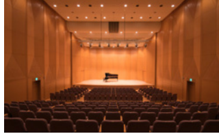
あじさいホール AJISAI Hall